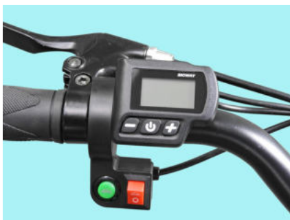
Computer di bordo