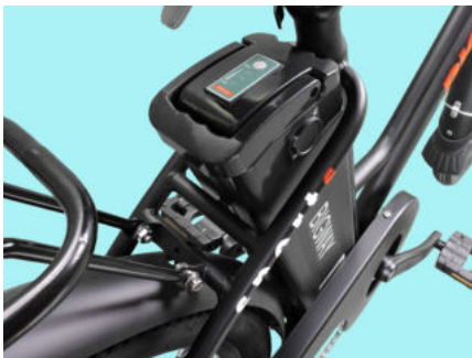
Batteria al litio 36V 10Ah

BIGWAY è la nuova bicicletta elettrica da passeggio. Il suo design classico ricorda quello tipico olandese ma, gli accessori, le caratteristiche e le nuove decalcomanie la rendono invece, una bici moderna ed elegante. Questa bicicletta elettrica renderà le vostre passeggiate in città dei piacevolissimi momenti della vostra giornata.