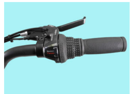
Comando SHIMANO Revoshift