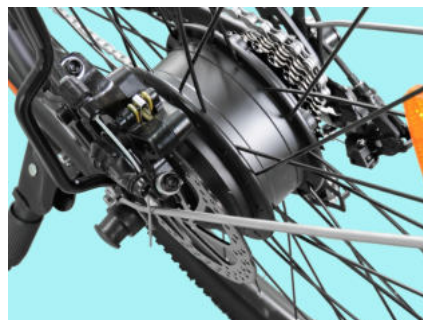
Motore elettrico 36V 250W