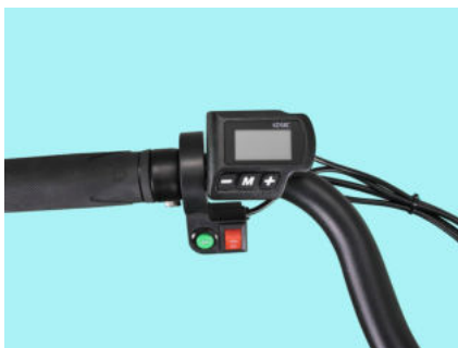
Computer di bordo