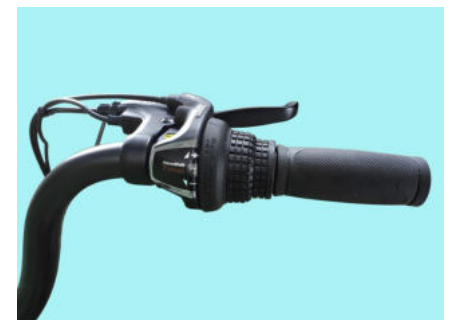
Comando SHIMANO Revoshift