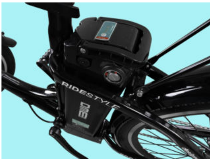
Batteria al litio 36V 10.4Ah

FRIENDLY è la nuova bicicletta elettrica da passeggio. Il suo design classico ricorda quello tipico olandese ma, gli accessori, le caratteristiche e le nuove decalcomanie la rendono invece, una bici moderna ed elegante. Questa bicicletta elettrica renderà le vostre passeggiate in città dei piacevolissimi momenti della vostra giornata.