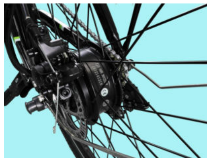
Motore elettrico 36V 250W